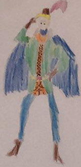
THE ROBIN HOOD